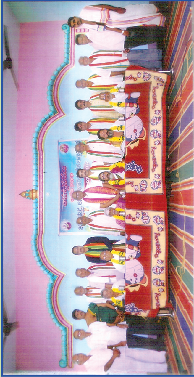
ఐ. 19-7-2017 తేదీ బుధవారం జరిగిన '20వ స్టార్ట్ ఆగమ అపర పండిత సన్మాన సభ'