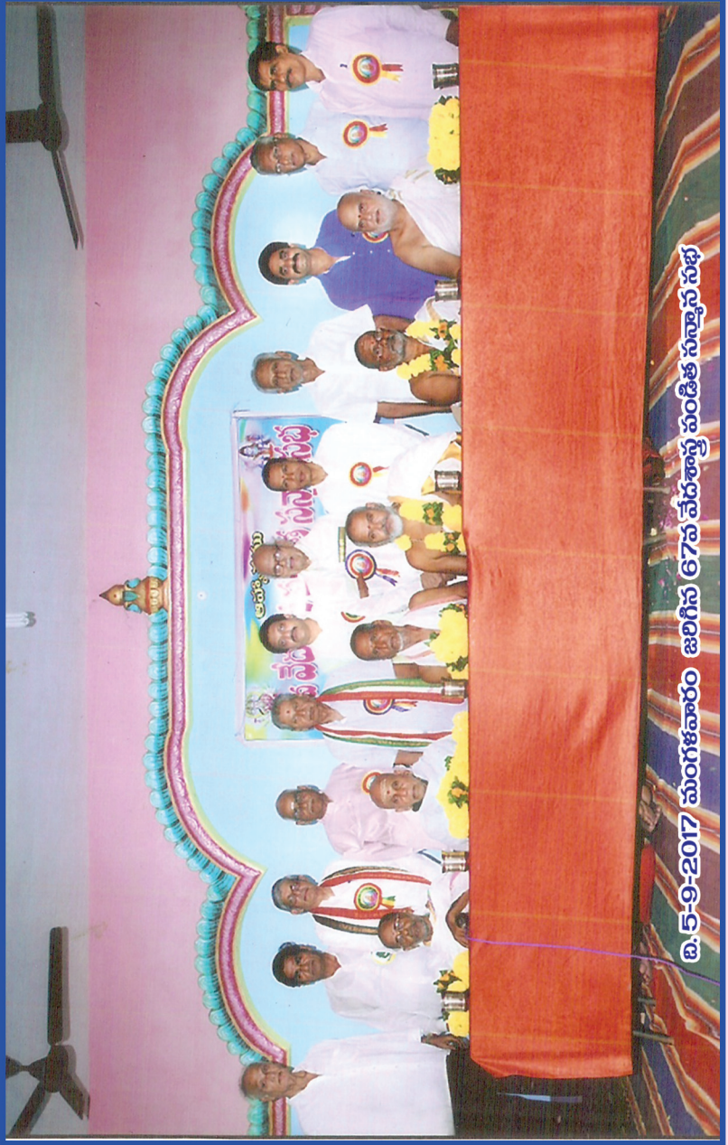
జరిగిన 67వ వేదశాస్త్ర పండిత సమ్మేళన సభ మంగళవారం 5-9-2017